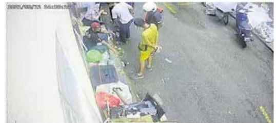
■ 不少流浪汉以后巷为家，引起商家忧心。（取自脸书）